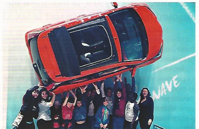
À la rencontre des Desperate Housewives ou de Gad Elmaleh ; en co-pilote au Slalom de Bière ou en VIP sur le stand Toyota à Genève.

Plus que tout autre, les jeunes malades ou en situation de handicap ont besoin de réaliser des projets qui les stimulent et leur donnent la force de se battre. Être le co-pilote de Sébastien Loeb ou rencontrer Gad Elmaleh, passer un moment inoubliable avec l'équipe de football d'Angleterre ou aller sur le tournage de Desperate Housewives à Hollywood – une diversité de rêves à la hauteur de leur imagination !